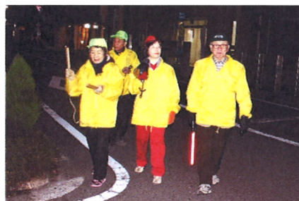
▲ 12/28 歳末警戒の様子