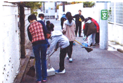
▲ 11/30 奥沢小学校児童と地域ボランティアによる 落ち葉掃き