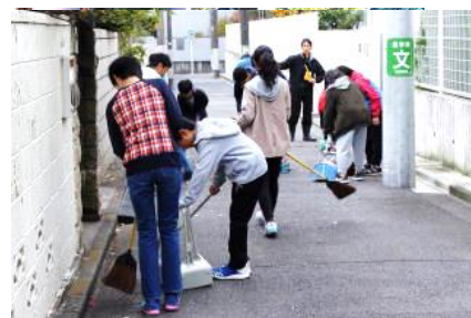
▲ 11/30 奥沢小学校児童と地域ボランティアによる 落ち葉掃き