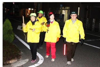
▲ 12/28 歳末警戒の様子