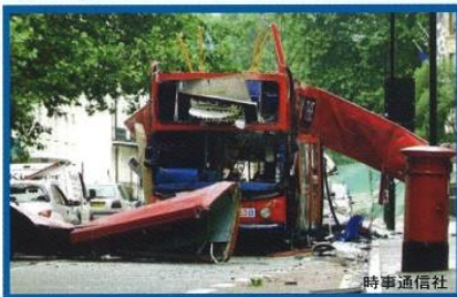
2005年7月ロンドン同時多発テロ事件

オリンピック・パラリンピック競技大会を成功させるためにも、皆さん一人一人の協力がが必要です。