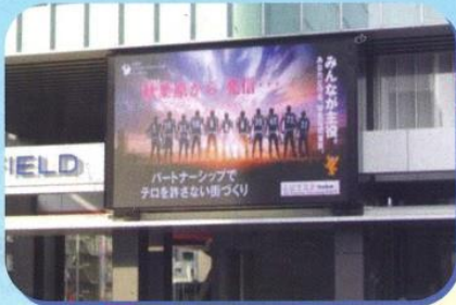
電光掲示による広報