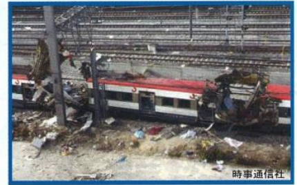
2004年3月スペイン同時列車テロ事件

皆さんの周りで、不審物を発見した場合は、「さわらない、ふまない、けとばさない」を守り、「いつもと違うな」「何かおかしいな」と思ったら、迷わず警察に通報してください。