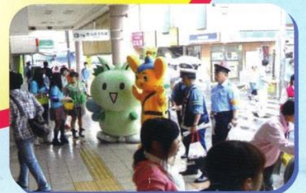
合同キャンペーン