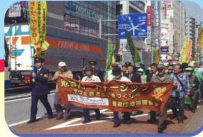
広報啓発パレード